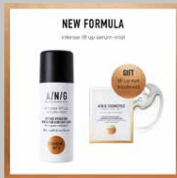
NEW Lift Up Serum-Mist + GIFT Single Eye Treatment van € 90,- voor € 75,-