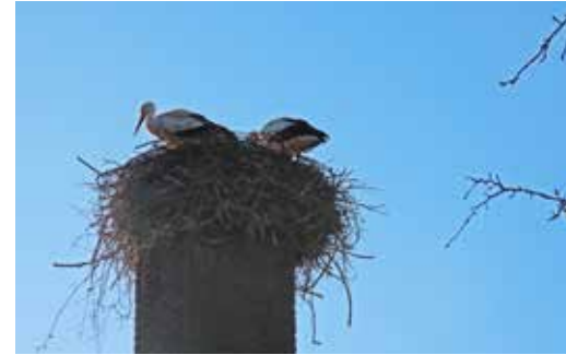
OIEVAARS VINDEN HUN NEST Leny van Schijndel