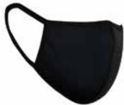
katoenen mondmaskers in diverse kleuren