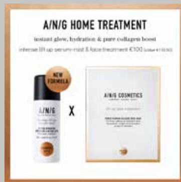
A/N/G Home Treatment Set van € 110,50 voor € 100,-